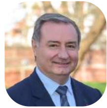
Jean-Luc Moudenc Maire de Toulouse, Président de Toulouse Métropole